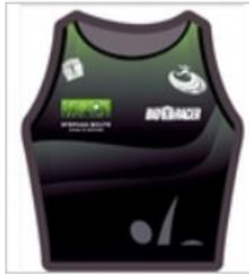
RUNNING BIKINI TOP WOMEN LYCRA