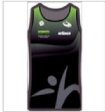
RUNNING SINGLET LADIES