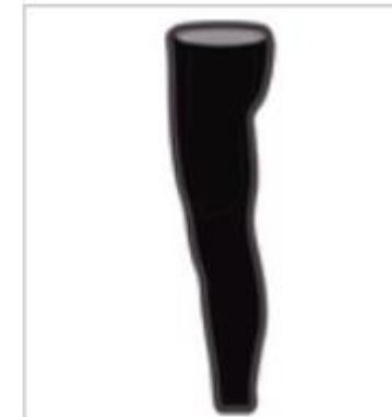
RUNNING TIGHT WINTER