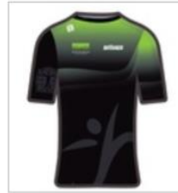
RUNNING SHIRT SHORT SLEEVES WOMEN