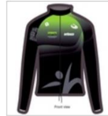
RUNNING JACK TEMPEST LIGHT LADIES