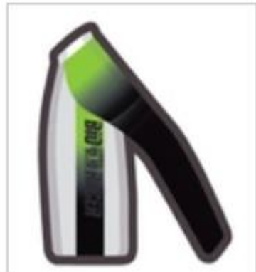
RUNNING SHIRT LONG