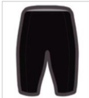
RUNNING SHORT LYCRA